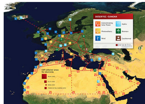
DESERTEC: Skizze einer möglichen Infrastruktur für eine nachhaltige Stromversorgung in Europa, dem Nahen Osten und Nord-Afrika

Die Zusammensetzung des Sonnenspektrums , die Sonnenscheindauer und der Winkel, unter dem die Sonnenstrahlen auf die Erdoberfläche fallen, sind abhängig von Uhrzeit, Jahreszeit und Breitengrad. Damit unterscheidet sich auch die eingestrahelte Energie. Diese beträgt beispielsweise etwa 1.000 kWh pro Quadratmeter und Jahr in Mitteleuropa und etwa 2.350 kWh pro Quadratmeter und Jahr in der Sahara . Es gibt verschiedene Szenarien, wie eine regenerative Energieversorgung der EU realisiert werden kann, unter anderem auch mittels Energiewandlung in Nordafrika und Hochspannungs-Gleichstrom-Übertragung . So ergaben zum Beispiel satellitengestützte Studien des Deutschen Zentrums für Luft- und Raumfahrt (DLR) , dass mit weniger als 0,3 Prozent der verfügbaren Wüstengebiete in Nordafrika und im Nahen Osten durch Thermische Solarkraftwerke genügend Energie und Wasser für den steigenden Bedarf dieser Länder sowie für Europa erzeugt werden kann. [7] Die Trans-Mediterranean Renewable Energy Cooperation , ein internationales Netzwerk von Wissenschaftlern, Politikern und Experten auf den Gebieten der erneuerbaren Energien und deren Erschließung, setzt sich für eine solche kooperative Nutzung der Solarenergie ein. Eine Veröffentlichung aus den USA namens Solar Grand Plan schlägt eine vergleichbare Nutzung der Sonnenenergie in den USA vor.