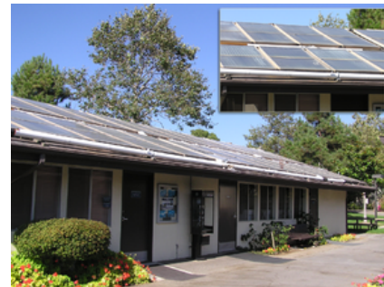
Ein Waschanlage in Kalifornien, USA, der sein Warmwasser mit Solarenergie erhitzt

Weltweit verfügbare Sonnenenergie. Die Farben in der Karte zeigen die örtliche Sonneneinstrahlung auf der Erdoberfläche gemittelt über die Jahre 1991–1993 (24 Stunden am Tag, unter Berücksichtigung der von Wettersatelliten ermittelten Wolkenabdeckung). Zur Deckung des derzeitigen Weltbedarfs an Primärenergie allein durch Solarstrom wären die durch dunkle Scheiben gekennzeichneten Flächen ausreichend (bei einem Wirkungsgrad von 8 %).