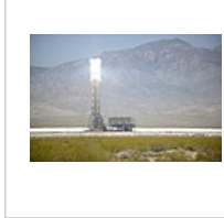
Sonnenwärmekraftwerk Ivanpah, USA