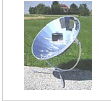
Solarkocher in Betrieb