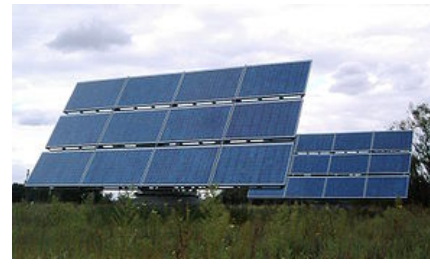
Photovoltaikanlage in Berlin-Adlershof