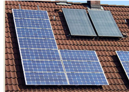
Solarmodul (links) und Sonnenkollektor (rechts oben)