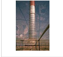
Aufwindkraftwerk Manzanares, Spanien